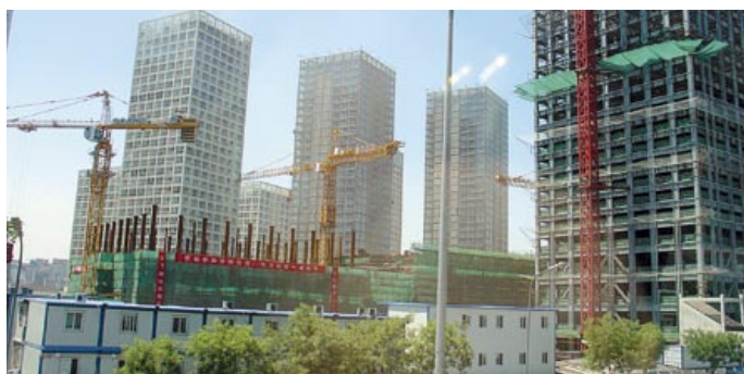
Lyftkranar och nybyggnationer förekommer överallt i de stora städerna.

– Staten och Qingdao stad investerar mer än femtio miljarder svenska kronor inför detta projekt. Ett helt nytt hamnområde där tävlingarna skall hållas samt vägar, järnväg och flygplatsen byggs ut. Till detta kommer värdet på de internationella investeringarna i form av industri och hotelletableringar.