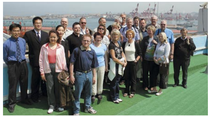
Mellansvenska Handelskammarens delegation synar en av Kinas största hamnar i Qingdao.

– För att förbättra luften i vår stad har vi ersatt stora delar av kol-kraften med naturgas. Kina utvecklar även sitt kärnkraftsprogram med tanke på den snabbt stegrande energiförbrukningen.