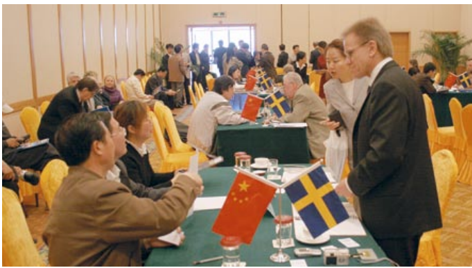
Internationella affärsmöjligheter då mängder av kinesiska företag ville träffa företagarna från Gävleborg och Dalarna.

– Tyvärr har väl nästan all produktion hunnit försvinna ur Sverige innan det politiska etablissemanget vaknar upp och inser (eller erkänner) den omvärldsförändring som sker.