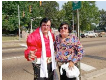
Vilka träffar man utanför Gracelands grindar ☒ jo, Elvisar förstås!