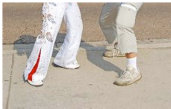
Alla sorters Elviskopior uppträder på den legendariska musikgatan Beale Street i Memphis.