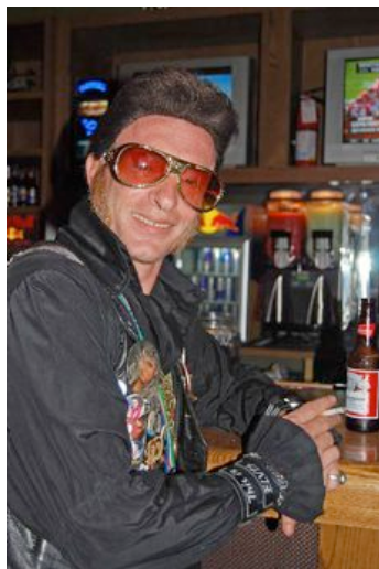
Elviskopior med skiftande likhet finns överallt.