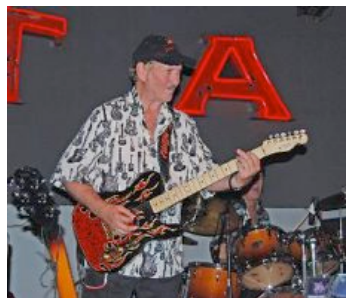
Elvis mångåriga gitarrist James Burton spelade med sitt hobbyband på puben Alfreds på Beale Street.

Tatuerad Elvisfan från Japan utanför legendariska Sun studio.