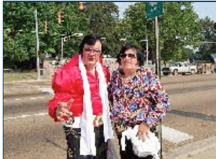
Vilka träffar man utanför Gracelands grindar - jo, Elvisar förstås!